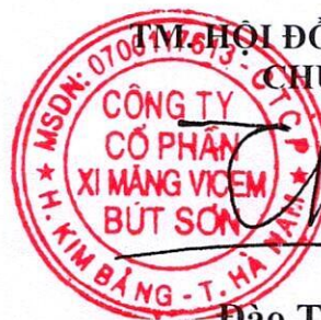
Đào Tuấn Khôi